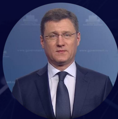
Заместитель Председателя Правительства Российской Федерации Александр Валентинович Новак

Иран может стать эффективной платформой для раскрытия потенциала стран Евразии в области торгового обмена и экономического развития. Посредством совместных инвестиций в различные экономические сферы мы можем не только способствовать росту экономического благосостояния, но и вносить вклад в укрепление двусторонних отношений.