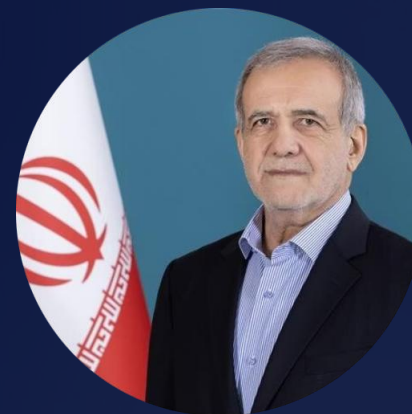
Президент Исламской Республики Иран Масуд Пезешкиан

Проведение совместной выставки (Выставка Евразия с 4 по 7 декабря 2023 года) в Тегеране, свидетельствует о сильном интересе российских компаний к установлению более плодотворных экономических и торговых отношений между двумя странами