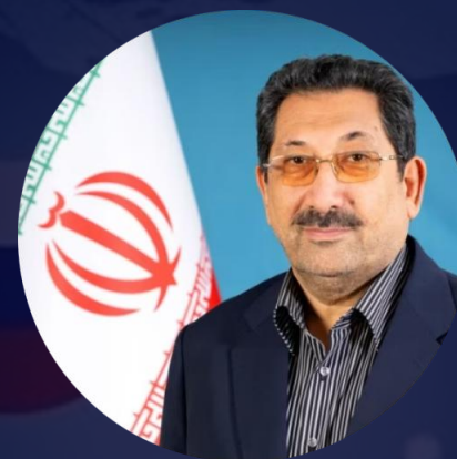
Министр промышленности, торговли и горной промышленности Исламской Республики Иран Сайед Мохаммад Аттабак

Важным направлением взаимодействия с Ираном является развитие торговых связей на евразийском пространстве, и выставка является отличным инструментом для достижения этой цели.