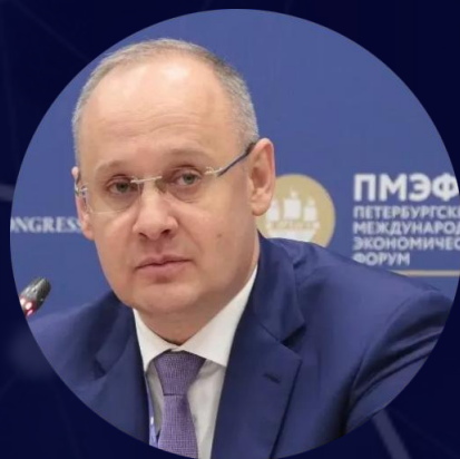
Советник Президента Российской Федерации Кобяков Антон Анатольевич

Важным направлением взаимодействия с Ираном является развитие торговых связей на евразийском пространстве, и выставка является отличным инструментом для достижения этой цели.