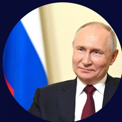
Президент Российской Федерации Владимир Владимирович Путин

Проведение совместной выставки (Выставка Евразия с 4 по 7 декабря 2023 года) в Тегеране, свидетельствует о сильном интересе российских компаний к установлению более плодотворных экономических и торговых отношений между двумя странами